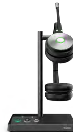
WH62 Dual Teams WH62 Dual UC