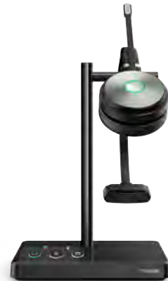
WH62 Mono Teams WH62 Mono UC