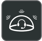
Tecnología Acoustic Shield

Yealink WH66 es el auricular inalámbrico DECT líder en la industria, con dos modelos WH66 Dual y WH66 Mono, lo que abre una forma completamente nueva de colaboración de escritorio. Trabaje sin problemas con las principales plataformas de UC e integre de forma nativa con los teléfonos IP de Yealink. La pantalla táctil capacitiva de 4.0 pulgadas (480 x 800) de la base ofrece una nueva experiencia de trabajo, con solo un toque, todo el control. Actúe como una estación de trabajo, gestione las llamadas telefónicas, conecte con varios dispositivos (teléfono de escritorio / teléfono móvil / ordenador), cargue el teléfono móvil de forma inalámbrica e incluso desempeñe la función de altavoz. Lo mejor de todo es que la implementación de una estación de trabajo tan multifuncional solo necesita conectarse directamente. Las cosas más fáciles de hacer, la mayor comodidad para disfrutar.