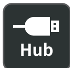
Hub USB integrado