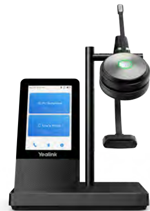
WH66 Mono/ Dual: Teams WH66 Mono/ Dual: UC