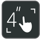
LCD de pantalla táctil