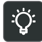
Luz de ocupado personalizable