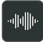
Experiencia de audio Optima