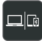
Conexión de varios dispositivos