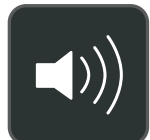
Modo de altavoz