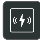
Cargador inalámbrico Qi